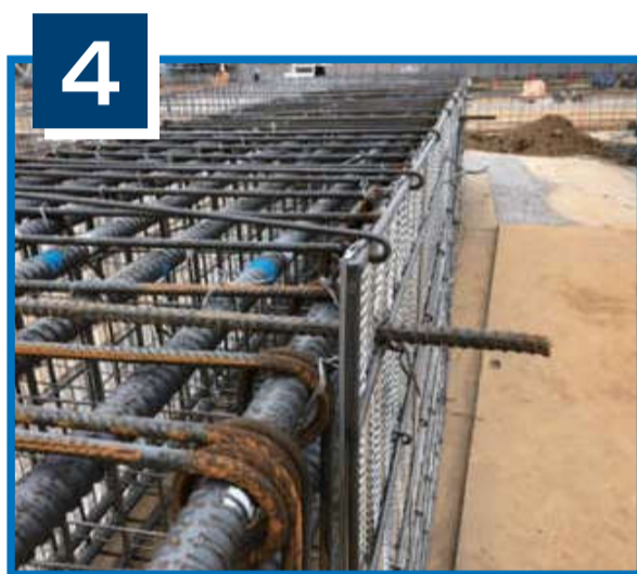
▲ 吊り上げ補強筋取り付け